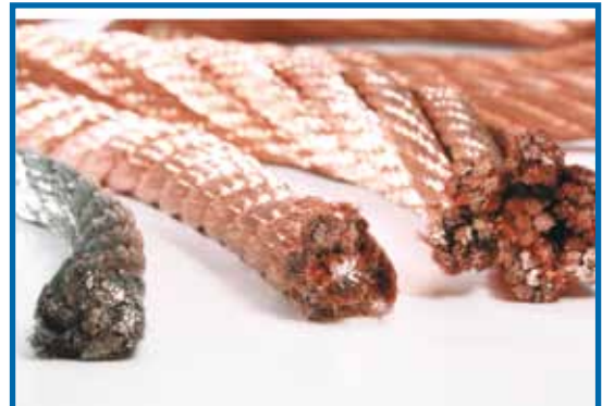
Gedrehte Kupferbänder / Kupferseile