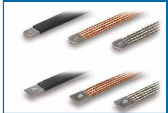
Flachbänderder / Massebänder