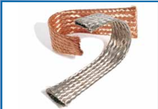
Geflochtene Kupfergewebebänder / Flachlitzen