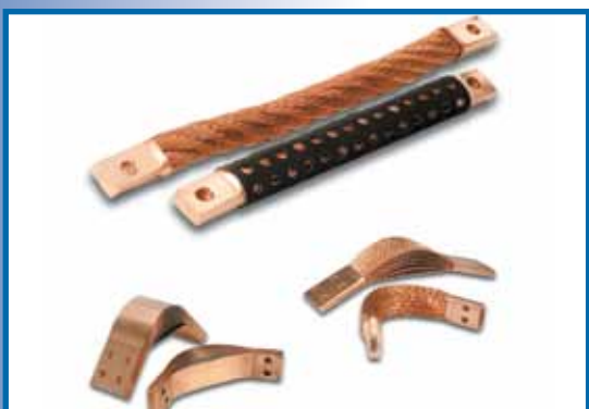
Flexible Kupferverbindungen für Schweißmaschinen