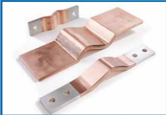
Flexible Dehnungsbänder / Lamellenbänder